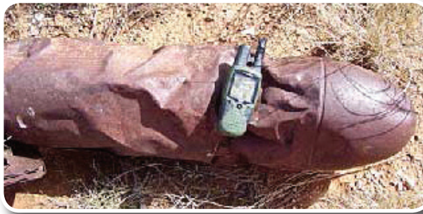
Bomba de entrenamiento en el antiguo Midland AAF

Ya que pueden permanecer peligros explosivos asociados con municiones de entrenamientos militares pasados en el antiguo Midland Army Air Field Ordnance Burial Pits No. 1 & 2, el Cuerpo de Ingenieros del Ejército de los EEUU recomienda que propietarios y visitantes sigan las 3Rs de Seguridad sobre Materiales Explosivos – Reconozca, Retroceda y Reporte.