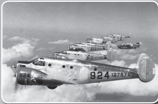
Cadetes de la escuela de aviación de Midland Army Air Field en aviones motor gemelo AT-11 ensayando sus habilidades de bombardeo